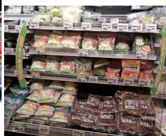
手間いらず カット野菜品