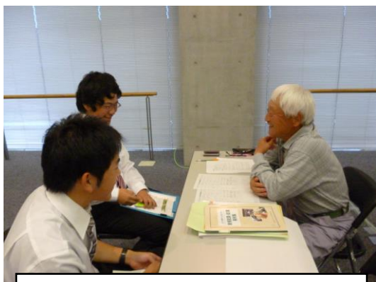
(有)鹿野アグリ ブース

8月2日（土）、山口市の山口健康づくりセンターで開催された、「ふるさとやまぐち農林業新規就農ガイダンス」（公益財団法人やまぐち振興公社主催）に出展し、集落営農法人の活動をPRしました。協議会会員法人のうち、（有）鹿野アグリ、（有）船方総合農場が出展しました。来場者数は約70名。農大生を中心に、農業に興味を持つ若い人も多く、「農業がやりたい」と真剣な姿が印象的でした。集落営農法人の果たす役割は、人材の受け皿としても、今後ますます大きくなりそうです。